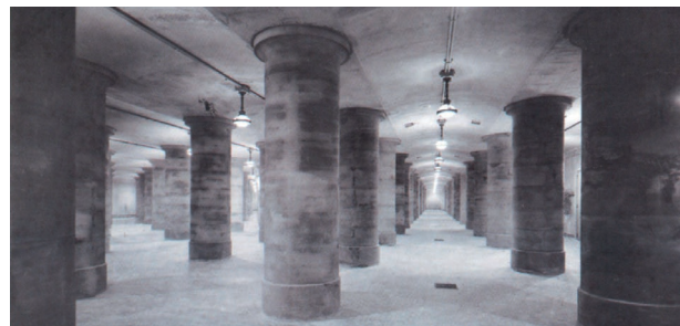
Les couloirs de la « Souterraine », à 27 mètres sous terre.