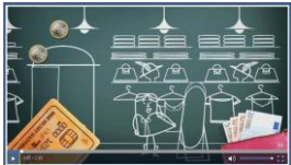
Vidéo (2mn03), octobre 2014 Institut National de la Consommation (INC)