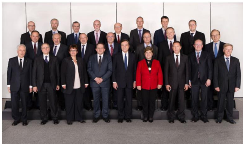
Le Conseil des gouverneurs de la BCE (janvier 2016)