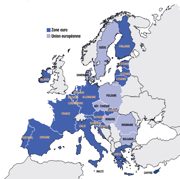
Zone euro et Union européenne au 1 er janvier 2023

L' Eurosystème , qui rassemble la BCE et les banques centrales nationales des pays de la zone euro, dont la Banque de France , veille par la politique monétaire à préserver la confiance dans la monnaie, sa valeur et la stabilité des prix . Il rend ainsi plus simples les décisions d'investissement et d'épargne pour les entreprises et les particuliers.